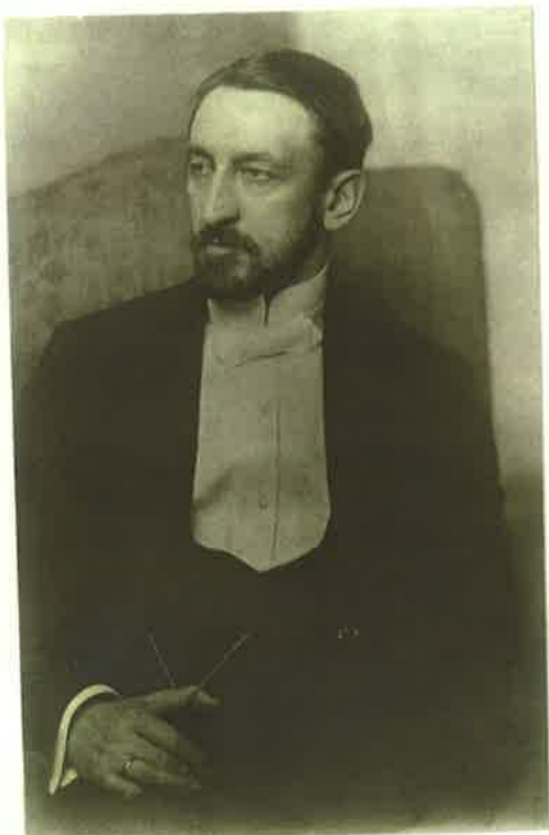
Józef Polikarp Brudziński