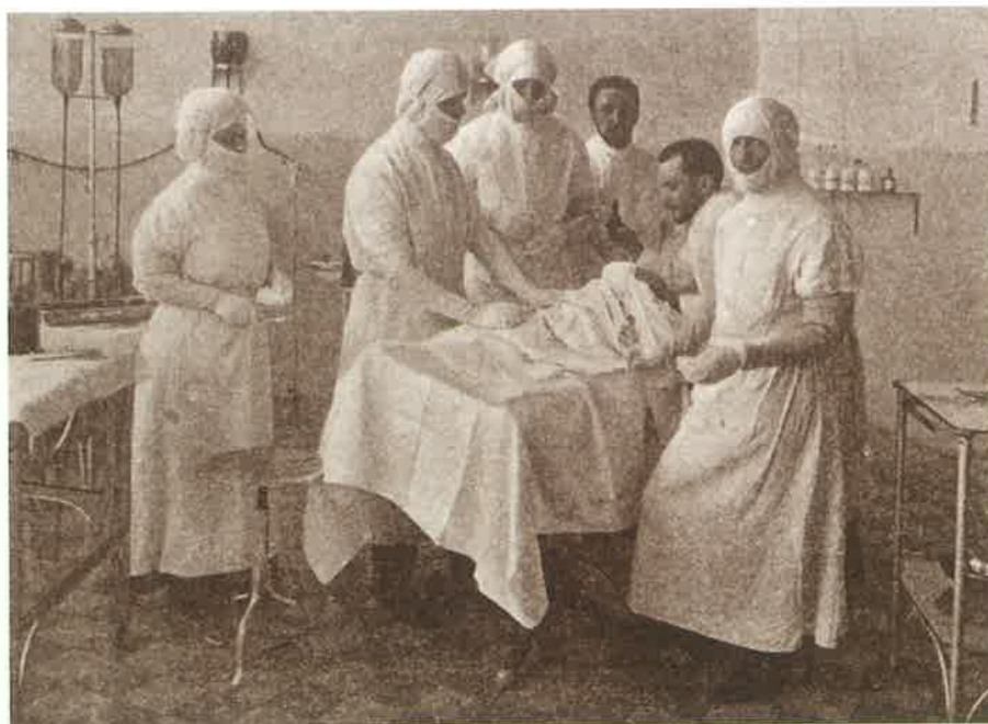
Sala operacyjna Szpitala Anny-Maryi w Łodzi („Tygodnik Ilustrowany”, maj 1906)

i funkcjonowania szpitala. Szkolił lekarzy i pielęgniarki w zakresie badania, leczenia i obchodzenia się z chorym dzieckiem. Wypowiedział walkę zakażeniom wewnątrzszpitalnym. Stworzył sortownię ambulatoryjną dla chorych dzieci, oddział obserwacyjny, wewnętrzny i chirurgiczny. Zastosował izolatki dla chorych zakaźnie, utworzył pawilon błoniczy i gruźliczy oraz sale dla ozdrowieńców. Szpital według pierwotnych założeń miał służyć dzieciom tylko chrześcijańskim, jednak Józef Brudziński wywalczył zmianę statutu. Dzięki niemu przyjmowano wszystkie chore dzieci bez względu na wyznanie, narodowość i stan majątkowy rodziców.